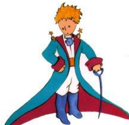
Aquí tienen el mejor retrato que más tarde logré hacer de él

Me puse en pie de un salto como herido por el rayo. Me froté los ojos. Miré a mi alrededor. Vi a un extraordinario muchachito que me miraba gravemente. Ahí tienen el mejor retrato que más tarde logré hacer de él, aunque mi dibujo, ciertamente es menos encantador que el modelo. Pero no es mía la culpa. Las personas mayores me desanimaron de mi carrera de pintor a la edad de seis años y no había aprendido a dibujar otra cosa que boas cerradas y boas abiertas.